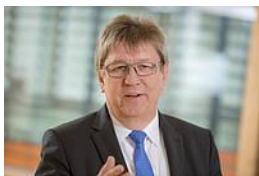
Ltd. RSD Ernst Fischer

Bayerisches Staatsministerium für Bildung und Kultus, Wissenschaft und Kunst